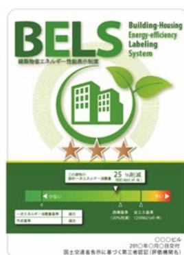
[図1] ガイドラインに基づく第三者認証の例

また、ダイヤモンドリスponsに対応した時間帯別・季節別の電気料金メニューが選択できる場合はその活用に努めるとともに、エネルギー管理システム（BEMS・HEMS等）の導入により、ビルの運用方法、住宅の住まい方の改善によるピーク対策及び省エネルギーに努めること。