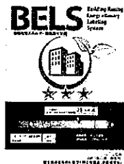
〔図1〕ガイドラインに基づく第三者認証の例

また、ディマンリスポンスに対応した時間帯別・季節別の電気料金メニューが選択できる場合はその活用にも努めるとともに、エネルギー管理システム（BEMS・HEMS等）の導入により、ビルの運用方法、住宅の住まい方の改善によるピーク対策及び省エネルギーに努めること。