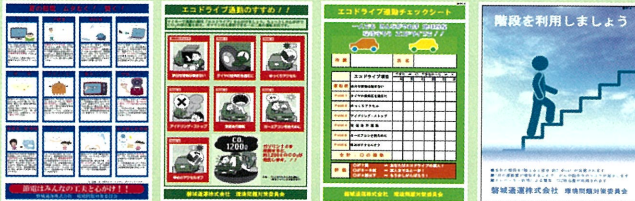
磐城通運株式会社の取組みの一部 (ポスター類)