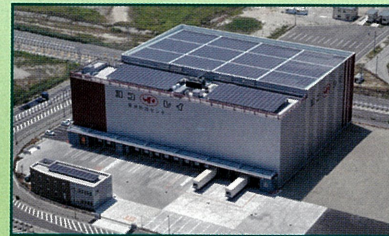
環境に優しい冷蔵倉庫「夢洲物流センター」