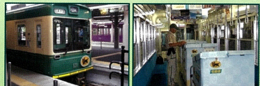
路面電車を利用したモーダルシフト