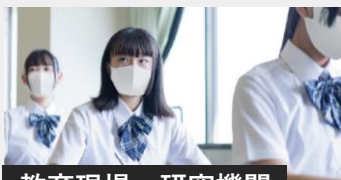
教育現場・研究機関

お客様訪問がある接客クルーやどうしても出社せざるを得ない職場でも、安心して働けることを目指します。