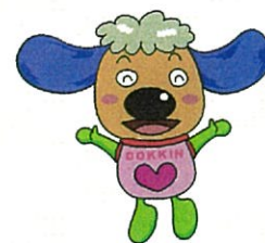
公正取引委員会 キャラクター どっきん