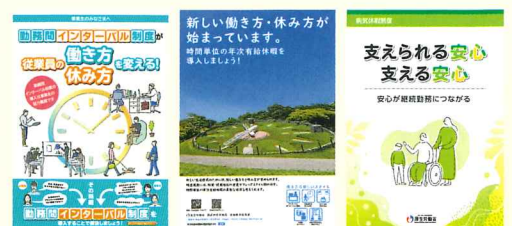
各制度に関するリーフレット（例）

「勤務間インターバル制度」「時間単位の年次有給休暇制度」「特別な休暇制度」などについて、企業の取組事例の紹介や、リーフレットなどの資料を掲載しています。自社における制度検討の参考にご活用ください。