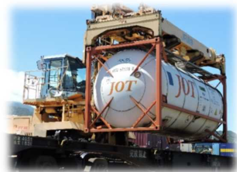
トップリフターによる荷役の様子