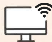
インターネットバンキング など